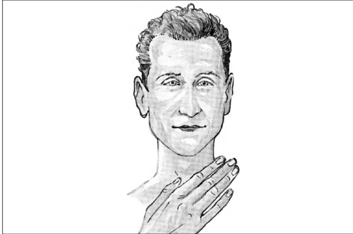
Abbildung 4: Vata-Typ (RHYNER 2004)

Vata ist das Prinzip der Luft – dies ist aber nicht gleichzusetzen mit der Luft, die wir atmen, sondern es ist die feinstoffliche Energie, die biologische Bewegungen reguliert. Vata ist demnach die Energie der Bewegung . Vata hat eine zerstreue Wirkung, ist leicht, klar, trocken, kalt, mobil und subtil.