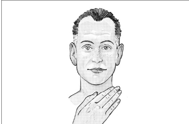
Abbildung 5: Pitta-Typ (RHYNER 2004)

Definition „Pitta“ Pitta wird übersetzt mit „Feuer“, es steht demnach für das Prinzip des Feuers , nämlich den Stoffwechsel bzw. die Energie der Erhitzung. Pitta neigt dazu, sich auszubreiten und ist heiß, ölig, leicht, scharf, stechend, flüssig und sauer.