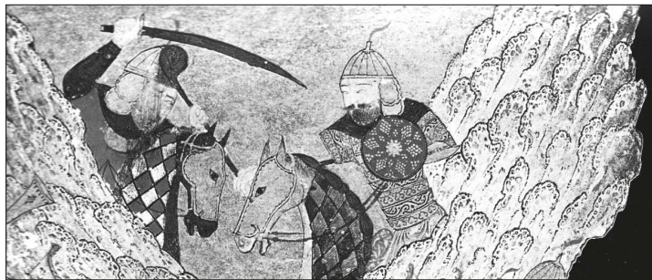
Abbildung 6: Reiter im Kampf mit Chinesen zur Zeit Dschingis Khans, Detailansicht (1155–1227) (BASCHÉ 1999)

Diese Entwicklung fand im europäischen Raum ihre Blütezeit im schwergepanzerten Rittertum des Mittelalters. In der Neuzeit behielt die im geordneten und disziplinierten Verband agierende Kavallerie über Jahrhunderte ihre Bedeutung. Der 1. Weltkrieg zeigte dann allerdings, dass das Pferd modernen Feuerwaffen, Automobilen, Panzern und Flugzeugen nichts als seinen Mut und sein Vertrauen zu seinem Reiter entgegensetzen hatte. Und doch setzten im 2. Weltkrieg noch 19 Nationen berittene oder bespannte Einheiten zur Unterstützung ihrer motorisierten Verbände ein. Allein in Deutschland starben ca. zwei Millionen Pferde während des Krieges. Es war aber der Verbrennungsmotor, der den Pferdebestand in Deutschland von ca. 1,5 Millionen Tieren, die zu Beginn des Wirtschaftswunders beim Wiederaufbau der Bundesrepublik halfen, auf etwa 252.000 schrumpfen ließ. Damit schien das Schicksal der Equiden im Westteil Deutschlands besiegelt. Denn nun hatte es seine Schuldigkeit getan und war nur noch ein „Luxusgut“, dessen Daseinsberechtigung sich hauptsächlich auf die Zucht von Renn- und Turnierpferden beschränkte (BASCHÉ 1999).