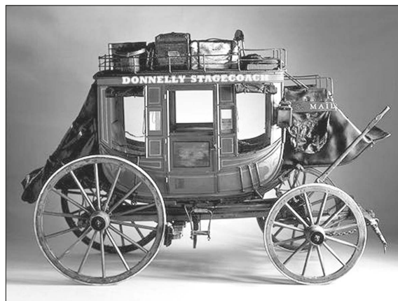
Abbildung 5: Englischer Stagecoach aus dem 16. Jahrhundert