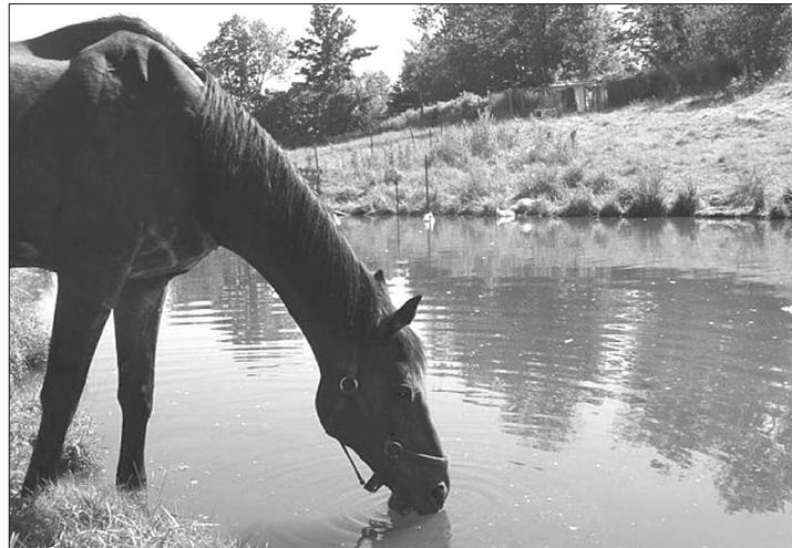
Abbildung 36: Natürliche Wasseraufnahme eines Pferdes ( http://hakkani.files.wordpress.com )

Tränken Als Saugtrinker erzeugen Pferde mit der Maulhöhle bei nahezu geschlossenen Lippen und Mundwinkelspalten einen Unterdruck und schlucken das Wasser in langen Zügen ab (ZEITLER-FEICHT 2001). Tränken sollten offene Wasserflächen haben, bei denen Kopf und Hals eine gerade Linie bilden, um den Abschluckvorgang zu erleichtern. In der folgenden Abbildung sieht man deutlich die natürliche Haltung eines Pferdes während der Wasseraufnahme. In der Stallhaltung zeigen Pferde drei, oft auch mehr Trinkintervalle. Als Bedarf werden (klimaabhängig) 5 bis 12 Liter Wasser je 100 kg Lebendgewicht angegeben. Fohlen müssen das Saufen von erwachsenen Herdenmitgliedern lernen.